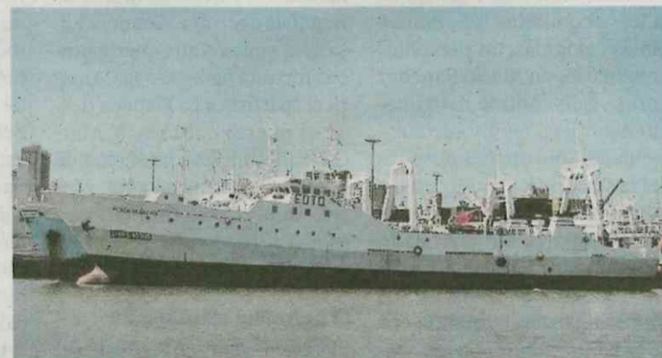
La tripulación del Pesca Vaqueiro está en perfectas condiciones.

Touza explicó que la obligación «legal» al seguir las pautas