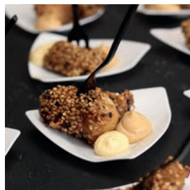
Bertorella con crujiente de sésamo y mayonesa de soja