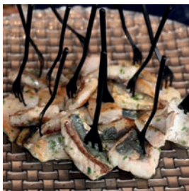
Chicharro marinado en aceite de aceituna negra de Aragón ahumado en madera de roble

La jornada finalizó en el restaurante Casa Miranda con una degustación de productos pesqueros con recetas variadas a base de especies de alto potencial comercial, como son la espardeña (pepino de mar), el chicharro, la bertorella o la boga, representativas de diferentes modalidades de pesca de la OPP-07.