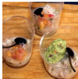
Ceviche de boga con mayonesa cítrica o con guacamole

Acción incluida en el Plan de Producción y Comercialización de OPP Lugo